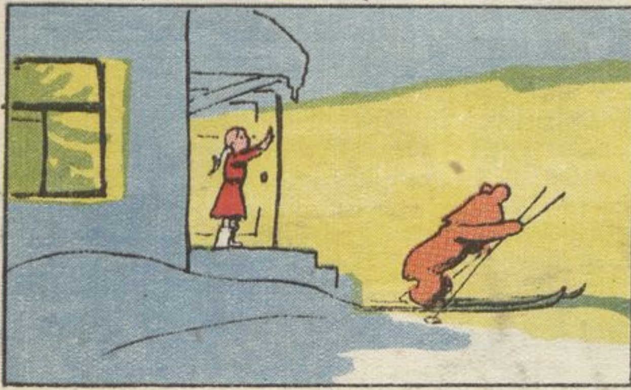
Рис. А. КАНЕВСКОГО

1. Кончился весёлый праздник. Погасла ёлка. „Ну, теперь прощай до весны, — сказал Топтыжка Маше. — Мне спать пора“.