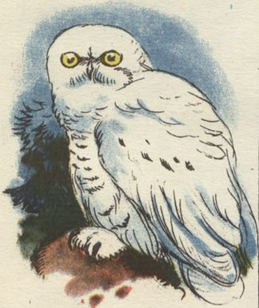
Рисунки к «Лесной газете» рисовал А. КОМАРОВ.

ИЗ ЗАПОЛЯРЬЯ. Неизвестно куда пропала наша белоснежная полярная сова. Мы её больше не встречаем. Посылаем снимок. Не встретил ли её кто у вас?